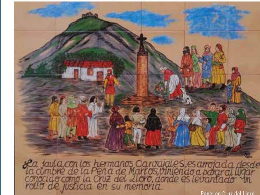
Panel en Cruz del Lloro

Martos cuenta con un importante número de edificaciones religiosas que se han ido construyendo a lo largo de la historia, plasmando los estilos de las diferentes épocas y sirviendo como testimonio y legado de nuestros antepasados.