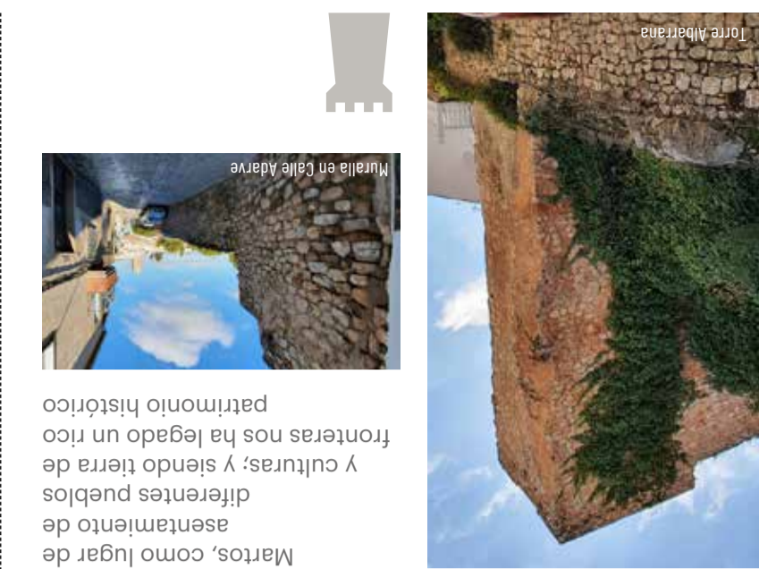
Miralía en Calle Alarve