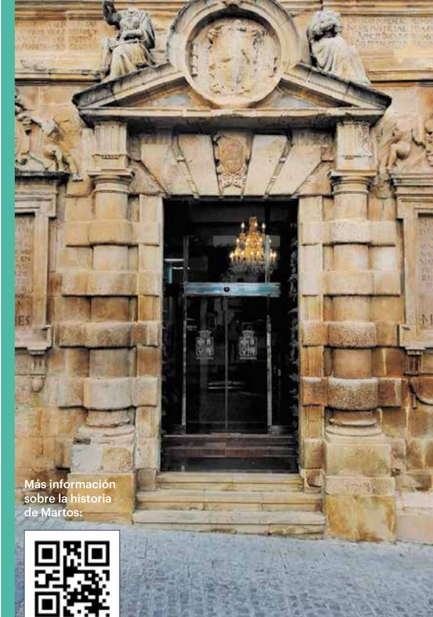
Más información sobre la historia de Martos: