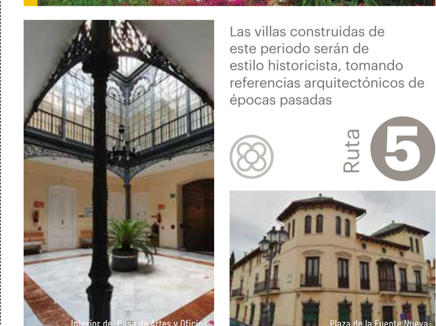
Interior de Casa de Artes y Oficios