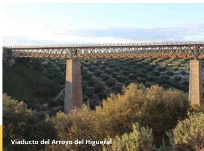
Viaducto del Arroyo del Higueral

Con la línea ferroviaria completa, la Linares-Puente Genil, se conseguía dar salida hacia el puerto de Málaga a la metalurgia pesada de Linares y de Belmez, y a los productos agroalimentarios de la provincia jiennense y del sur de Córdoba, principalmente aceite de oliva, por lo que se le denominó popularmente como “El Tren del Aceite”.