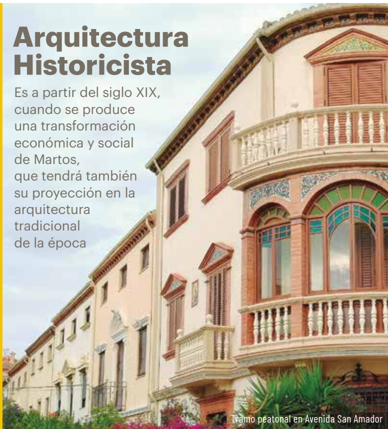
Tramo peatonal en Avenida San Amador

Es a partir del siglo XIX, cuando se produce una transformación económica y social de Martos, que tendrá también su proyección en la arquitectura tradicional de la época