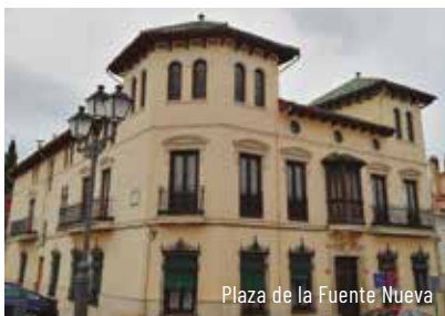
Plaza de la Fuente Nueva